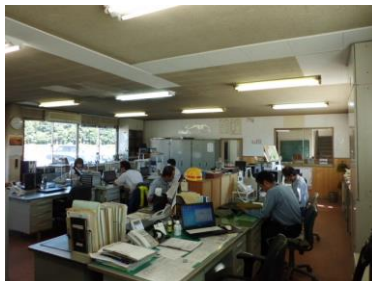
[ワンフロア化した本社・半田埠頭駅]

また、本社と半田埠頭駅をワンフロア化し、本社と現業機関のコミュニケーションを活性化させるとともに、日々の輸送状況、異常時の対応等における本社との情報共有を図るようにしました。