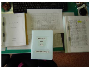
[運転作業要領・作業ダイヤ・チェック表]

また、規程類は一元化し、各部署に常備しています。また、内容については、たえず精査しています。